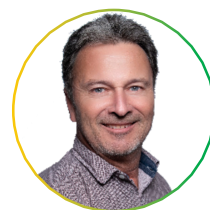
Pierre-Yves Genoud Animations – Visites